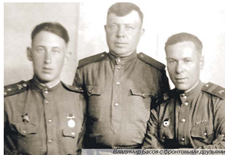
Владимир Басов с фронтовыми друзьями

Стоит отметить, что сняли «Щит и меч» в рекордные сроки. На четыре серии ушло всего два года. Причём Владимир Басов мог бы уложиться и в один год, если бы не бюрократические проволочки. Так как киноэпопея по большей части своей снималась в Калининграде, Берлине и Кракове, то постоянно требовались разного рода документы для переездов съёмочной группы.