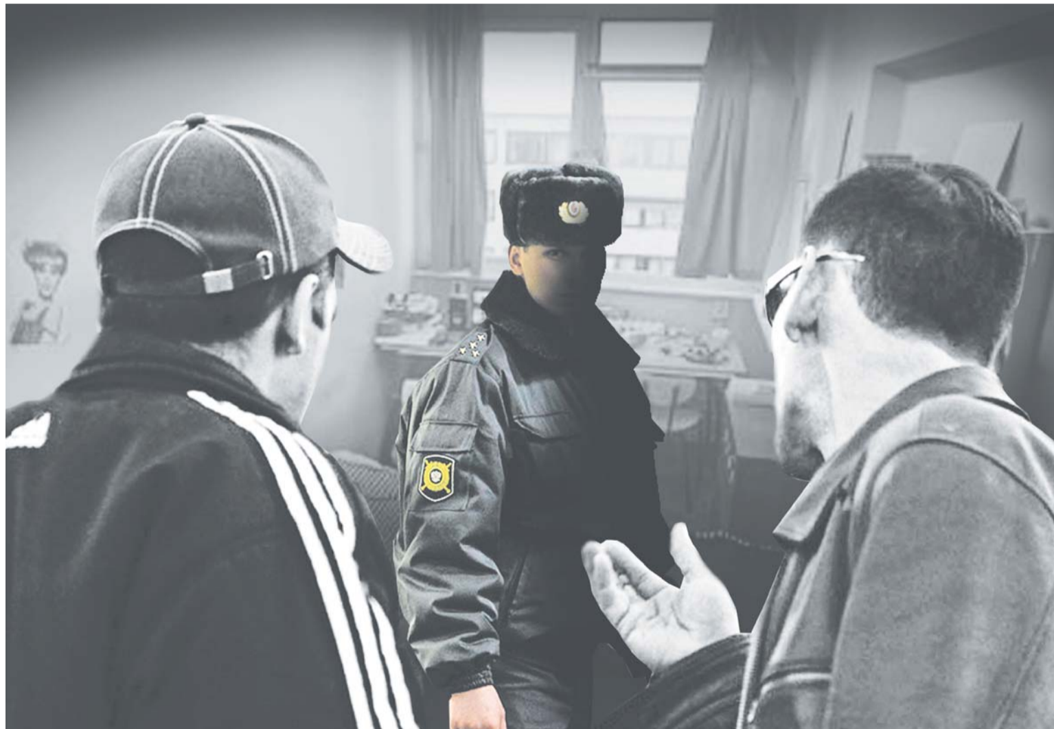
Коллаж Евгения КАРТАШОВА

Но и это ещё не все «чудеса следствия». Была назначена ситуационная судебно-медицинская экспертиза, в результате которой подтвердилось: телесные повреждения Сорокину (а они, не считая окровавленной головы, конечно же, остались после жёсткого задержания и применения наруч-